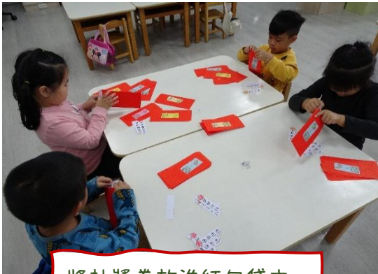
將抽獎券放進紅包袋中