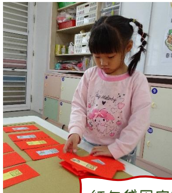
紅包袋固定於抽獎板上