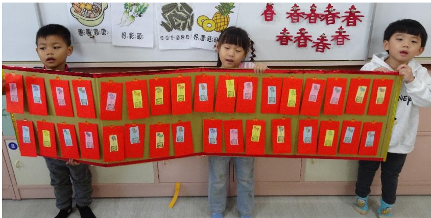
完成闖關者可以抽一包紅包！