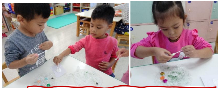
禮物袋裝飾：年年有餘。(灑亮粉貼亮片)