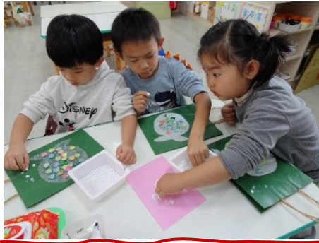
由孩子們手工製作的禮物袋 (三款)在這週全部完成囉！