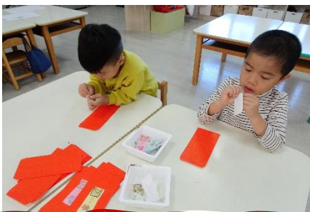
「馬上有獎」紅包袋封面黏貼

今年是馬年，所以抽獎紅包上也取馬年的雙關-「馬」上有獎，希望各位能在馬年中大獎~~