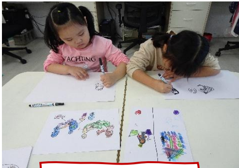
把關卡流程畫下來

關卡組的孩子們在上次想出了關卡後，面臨到一個問題：「我們怎麼樣讓所有的哥哥姐姐知道闖關內容？每一個人來闖關都要介紹一次嗎？」 孩子說：「我們可以請哥哥姐姐排隊後一起說」 但是，哥哥姐姐闖關是陸陸續續的來，似乎沒有辦法從頭到尾完整聽到內容，又有孩子說：「 不然我們準備大聲公？像是外面賣東西的那樣可以重複播放？ 」不過也有孩子發現：「 我們沒有大聲公欸~~ 」一度陷入沉思，後來有孩子想到：「 阿不然我們畫下來先讓哥哥姐姐知道呢？ 」另外一個孩子馬上說：「 那要一人一張阿！不然怎麼看？ 」最後，我們決定把闖關介紹畫在闖關卡後，這樣哥哥姐姐就能一人一張了！