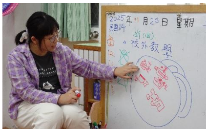
準備萬全才能出發