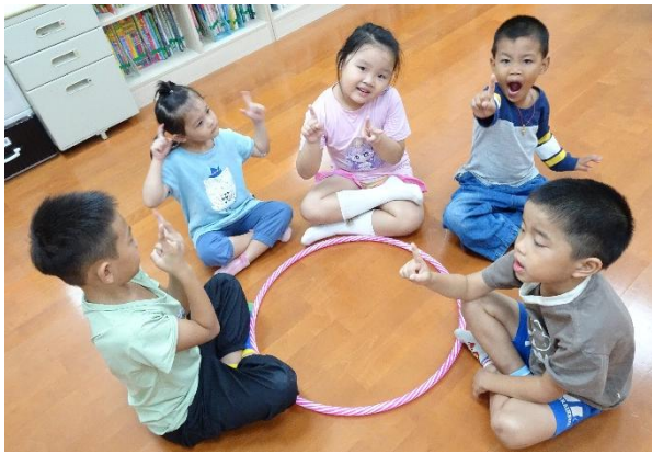
我們是 1 車