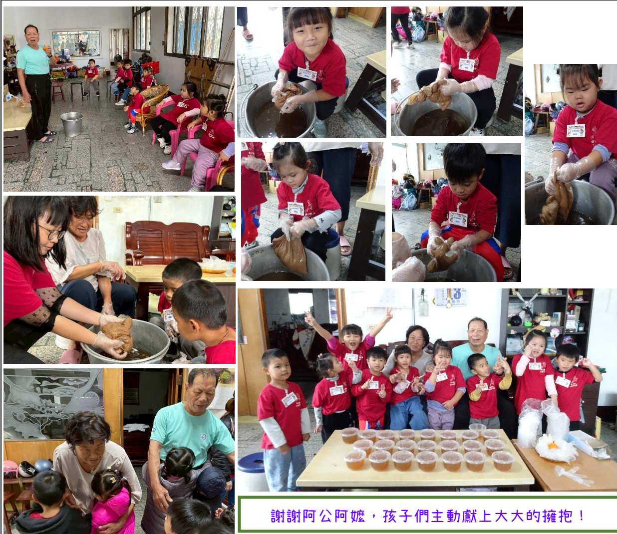
謝謝阿公阿嬤，孩子們主動獻上大大的擁抱！