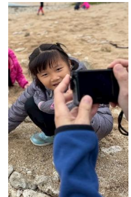
漂亮的畫面 盡收眼底。