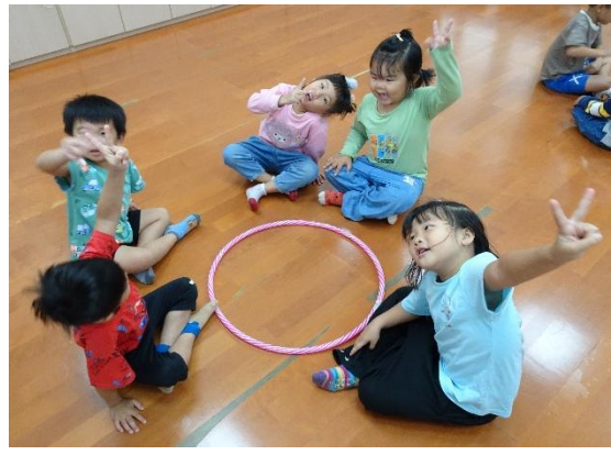
我們是 2 車