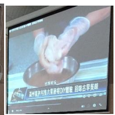
看著校外教學的路線和活動，孩子們目不轉睛