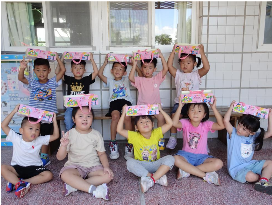
感謝給許孩子英的基月金餅會