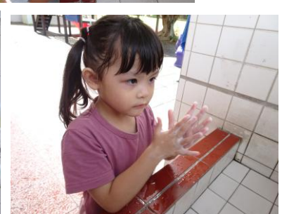
每天勤洗手，病毒就會遠離我