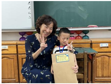
校長頒發開學能量包給我們！