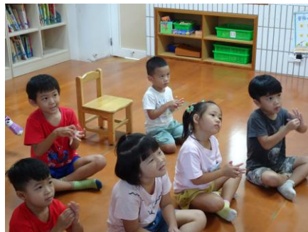
跟著洗手五步驟及七字訣做一次，會的人複習一次，還不會的小朋友趕快要記起來喔！