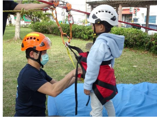
體驗前最重要的安全裝備