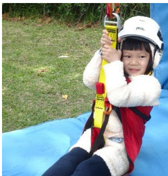
跟著繩索緩緩上升