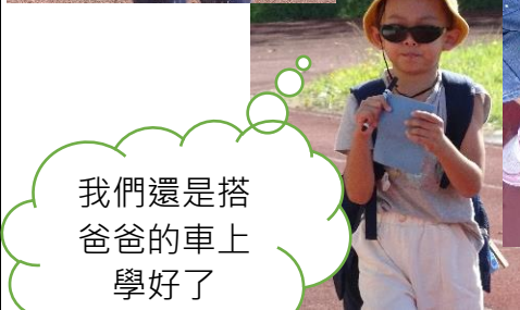
我們還是搭爸爸的車上學好了