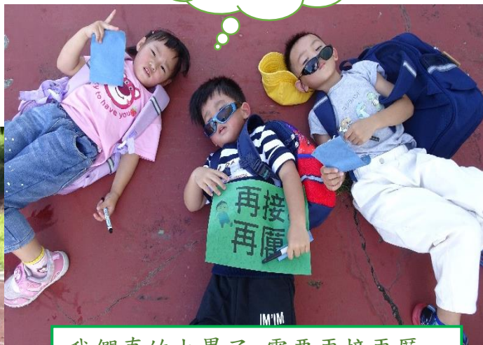
我們真的太累了~需要再接再厲~