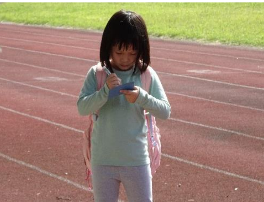
用 1~15 的數字表格來做紀錄，完成一圈操場就可以標記起來，看看自己是否能挑戰成功