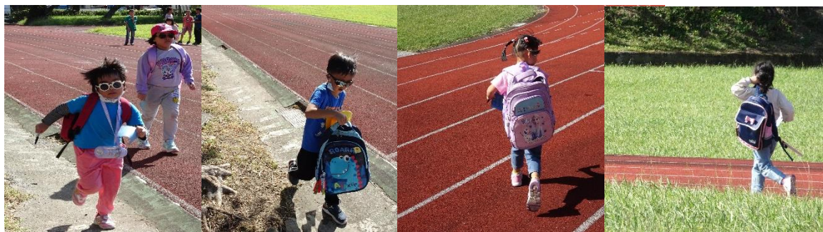
奔跑吧~~學校就快到了，加油加油~~~