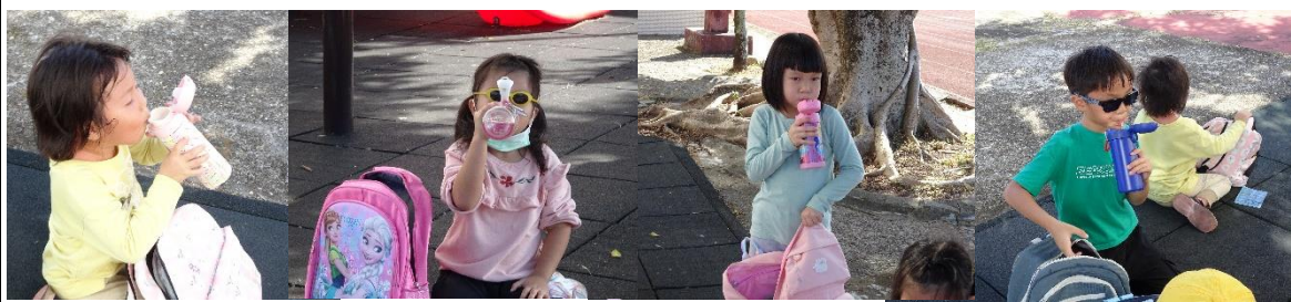
路途遙遠，不忘補充水分