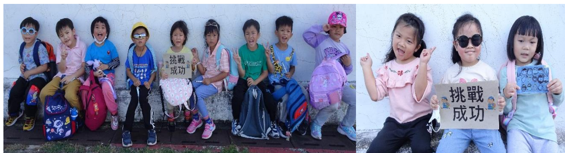
滿茶古道上學路 3 公里挑戰成功~~