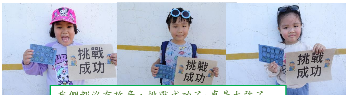
我們都沒有放棄，挑戰成功了~真是太強了