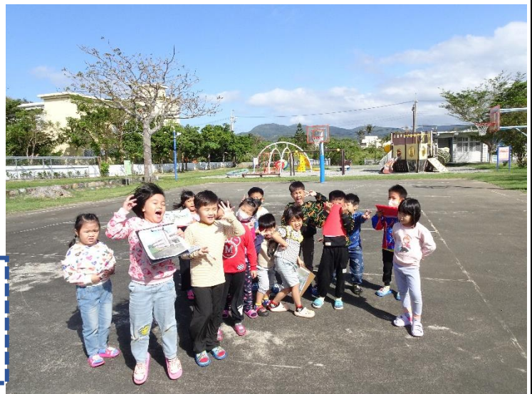
以前不是飛鷹號耶！ 遊樂器材變了好多，連籃框的 位置跟方向也變了！