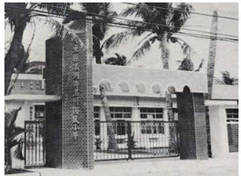
校門口以前沒有可愛的 灰面鷲鷹裝置藝術！