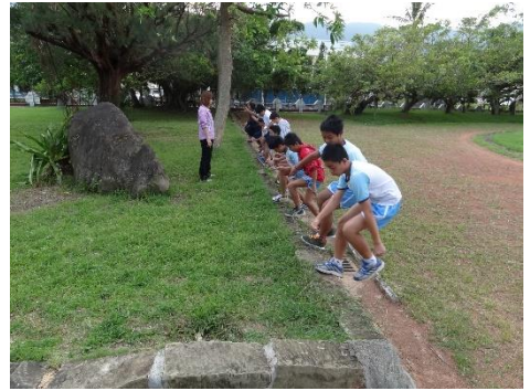
大石頭還在耶！ 甚至連石頭旁的植物都變， 不過，操場變得不太一樣