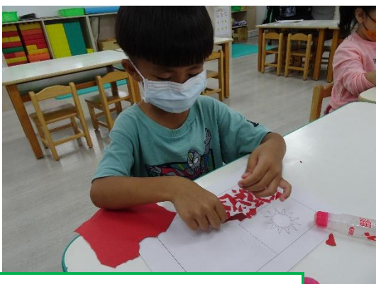
中大班利用色紙撕貼畫，小班利用印泥手指蓋印畫