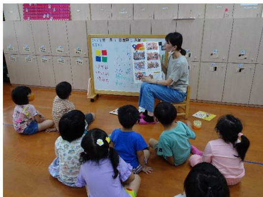
認識國慶日的由來