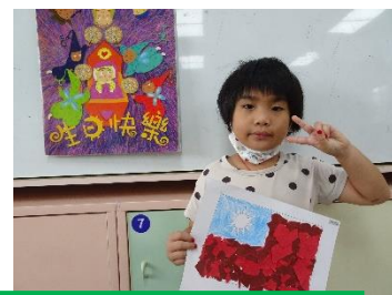
中華民國的國旗創作完成囉，祝中華民國生日快樂