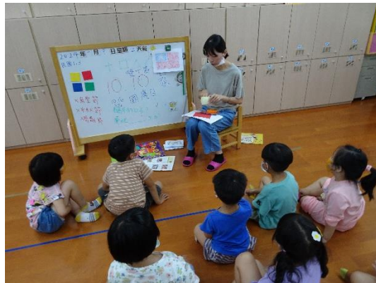
介紹國旗的藝術創作