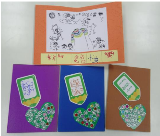
內頁插畫是由潔穎畫的喔~