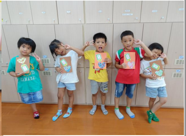
祝福全校所有的老師，教師節快樂，快來收下我們的愛！