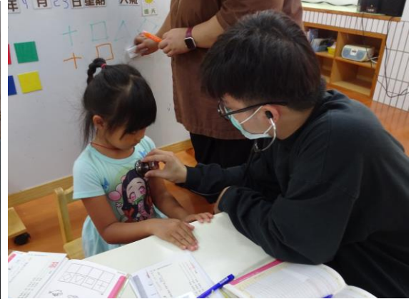
好忙好忙的健康檢查活動，家長在家也要多多留意孩子的健康狀況喔