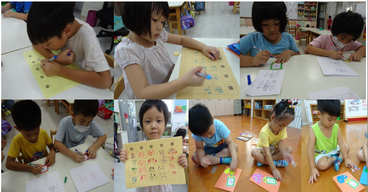
大家一起分工合作，完成教師節卡片

教師節，是屬於老師的節日，謝謝老師們陪伴我們成長，我們也做了可愛的教師節卡片，送給國小的老師們，表達我們的祝福與愛意。(卡片中的文字都來自孩子喔~~大班是用仿寫的方式，中班則用描寫)。