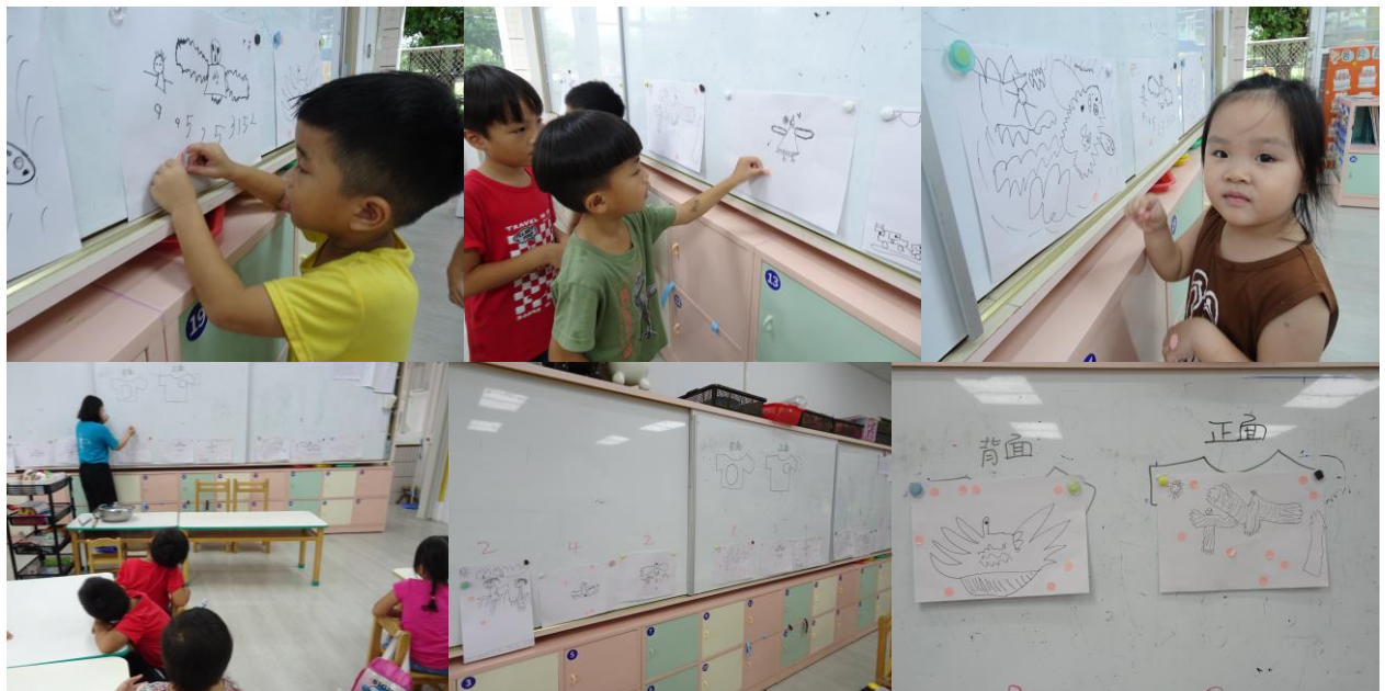
自由投票後，一起計算點點，統計每張圖的票數，並選出最高及第二高票