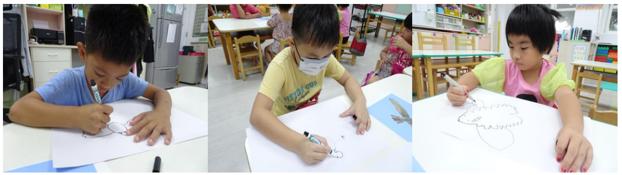
大班的孩子們畫下灰面鵞鷹，每個人都很有自己的特色喔