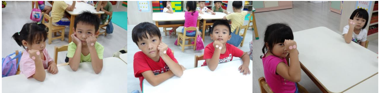
發下票選貼紙，一個人兩票，並依照自己的喜好進行投票