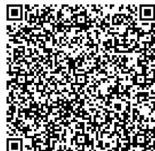
團賽報名表格下載