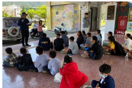
志工們遠道而來為畢業生(六年級和幼兒園大班)拍攝畢業照