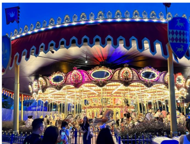
※2023 年 前進香港迪士尼