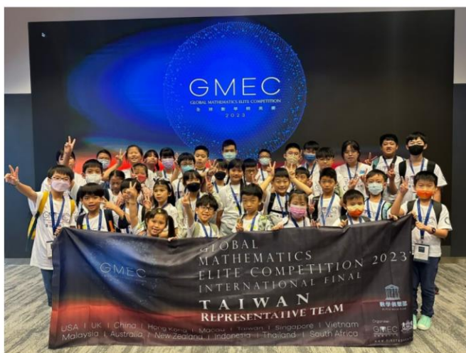
※2023 年 台灣代表隊