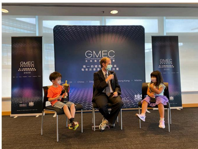
※2020 年 與教授的一席話

2. AoPS 遊學團獎金：全球冠軍將獲得參加 AoPS 遊學團的全額獎學金。（僅包含課程）