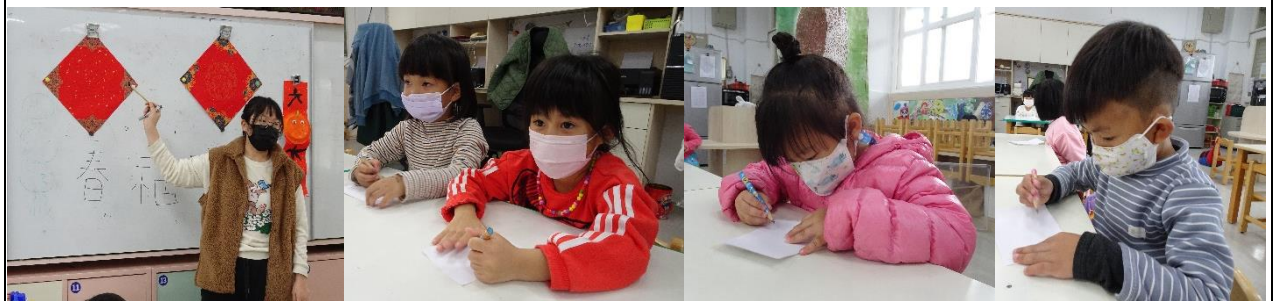
一字春聯，仿寫「春」、「福」、「吉」，使用毛筆前，我們先用鉛筆寫看看