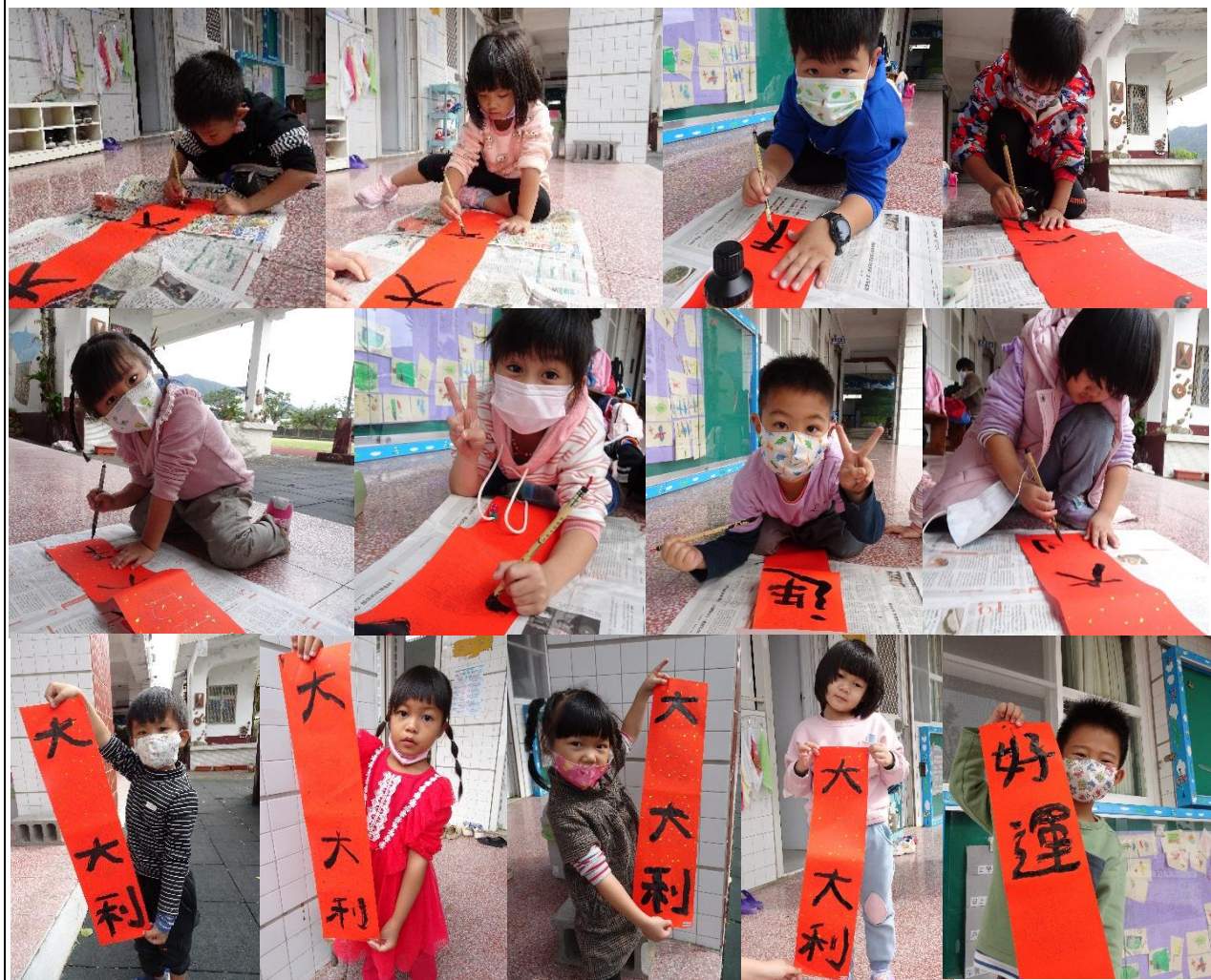
什麼??春聯的字怎麼只有寫一半?別緊張! 我們最後要將創作好的紙盤(橘子跟鳳梨)黏貼上去,可愛童趣的 吉祥話春聯,就大功告成囉!大家都十分的期待呢!