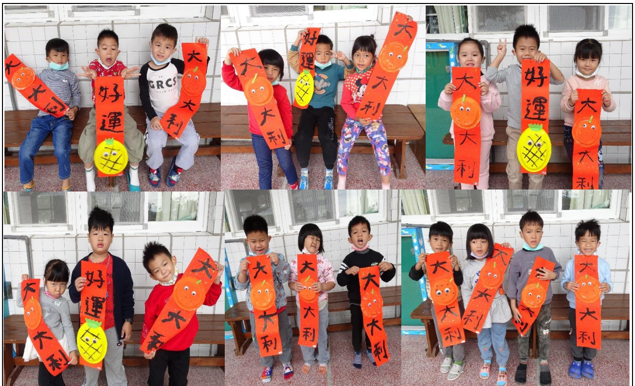
祝福大家：大吉大利(橘子)、好運旺旺來(鳳梨)