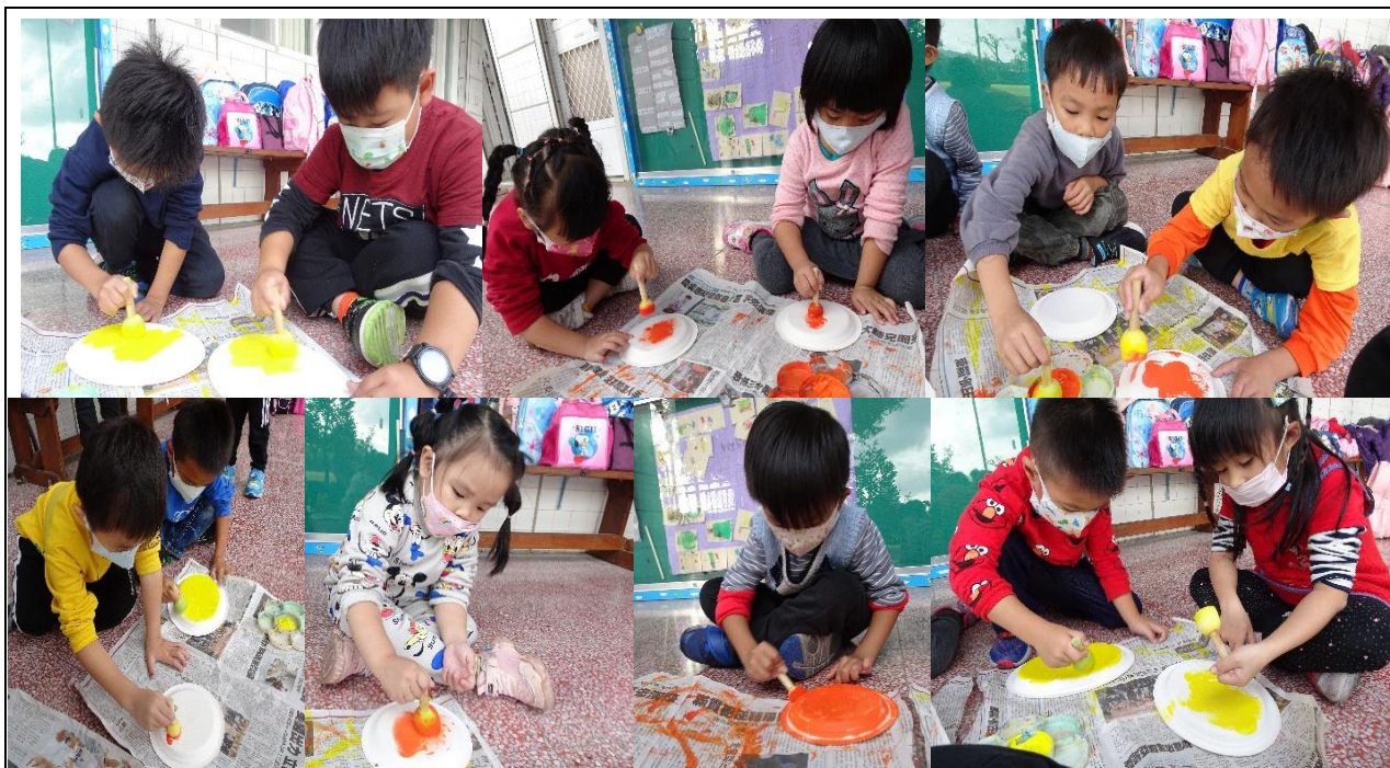
四字春聯結合紙盤創作，很費工，但成品很可愛