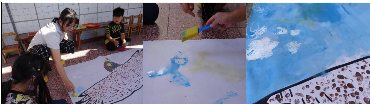
大膽刷上水彩，就會發現！哇~太陽跟雲都跑出來了！