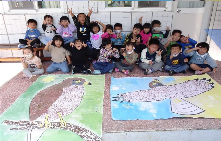
大家分工合作，完成！