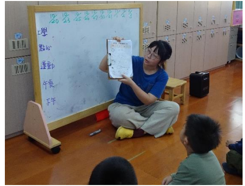
一起來看看之前的觀察紀錄表

孩子們在討論大海報背景時，說到自己「觀察」到灰面鵟鷹出現的時候。延續前一天的話題，我們以「雙向細目表」的方式統整先前孩子們分組追蹤的觀察紀錄，以「時間」為縱軸，日期為「橫軸」，有看到灰面鵟鷹者畫紅色△，沒有觀察到的時間則打叉，最後請孩子從整理出來的資料中仔細看看有沒有發現什麼特別事！