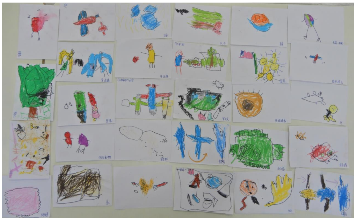
孩子們的畫風相當可愛，分工合作完成了所有想法的紀錄，先用運簽字筆先畫線條，再用蠟筆著色，每個人畫出來的圖案都相當有特色喔！