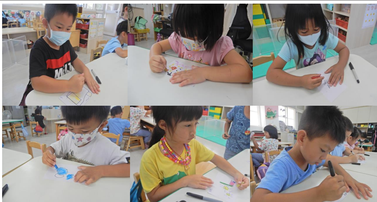
孩子們將已經分類好的想法畫下來囉！下一週，我們一起將這些圖卡重新歸類，完成我們這學期的主題網喔~~~~