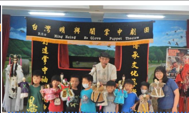
布袋戲真的好有趣喔！原來操作起來很不簡單，叔叔們好厲害喔！太專業了！