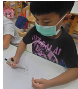
小小設計師創作中