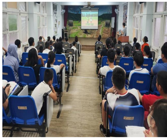
國小部學生在朝會時間，也欣賞了運動會的宣傳影片，一起為幼兒園廣播宣傳。