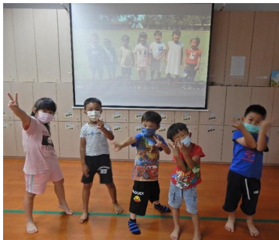
廣播組的孩子將運動會的每個流程都拍成了動態影片，極力的為滿州附幼的運動會做宣傳，邀請大家一起來參與