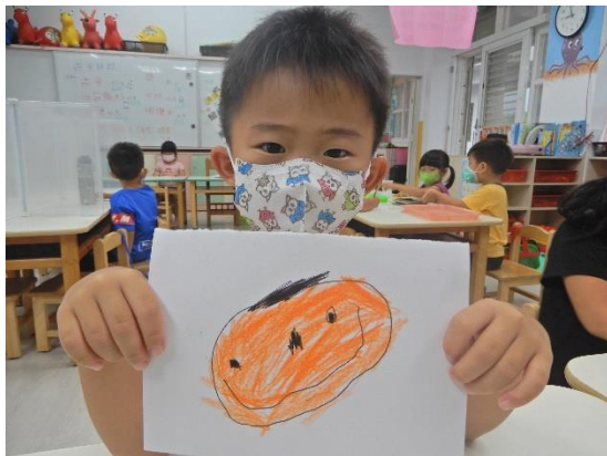
畫上自己的自畫像，超級可愛的，也超像自