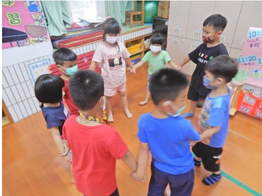
飛鷹組隊 口號是:飛鷹~飛鷹~gogogo

這個禮拜六我們要進行運動會囉，孩子們期待了非常的久，也為了運動會提早做準備，在運動會上有許多的競賽項目我們需要做分組的方式做進行，如親子趣味競賽呼拉圈渡河、親子大隊接力、兩人三腳四手，所以今天帶著孩子們做分組並且幫自己的隊伍取名還有加油的口號，來看看自己的隊員有哪些人吧，期待兩組隊員都能夠有好成績，請一起努力加油喔！