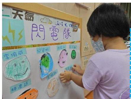
貼在海報上， 可以讓 運動會 當天讓 家長看