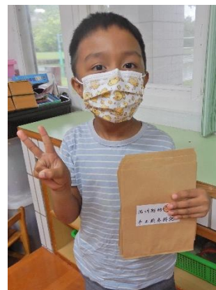
孩子們忙著做事前的加工，在要裝燕麥餅乾的袋子上貼了菊州附幼手工燕麥餅乾的貼紙