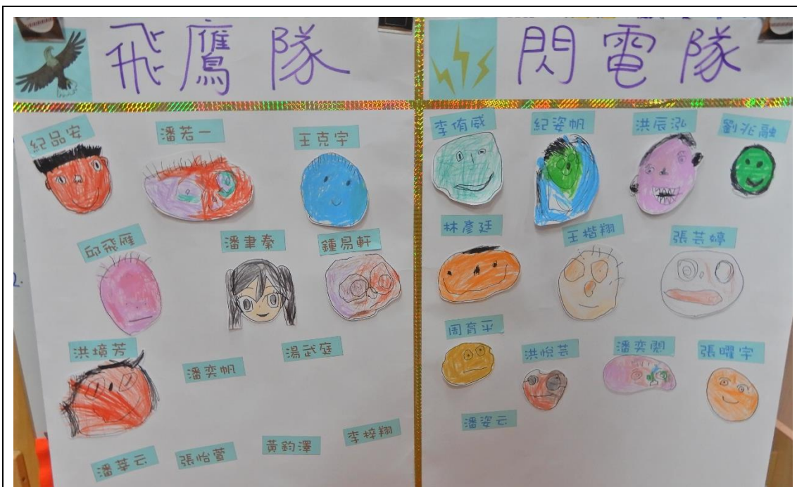
運動會競賽分組海報，找找看自己在哪一隊