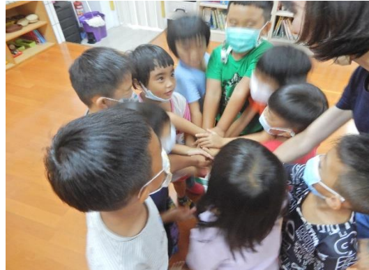
閃電組隊 口號是:閃電閃電閃電， 加油加油加油