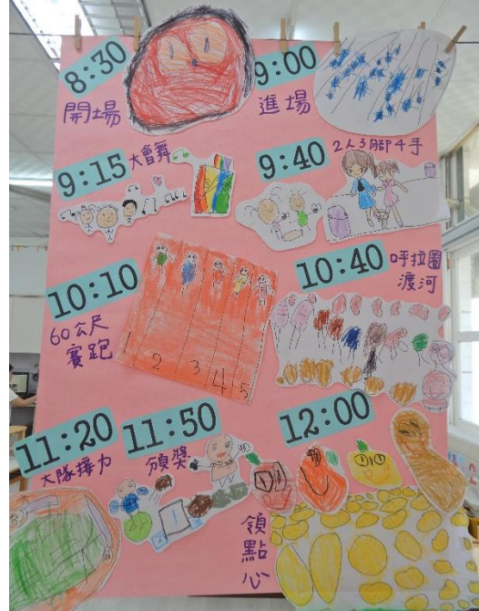
海報組孩子創作了宣傳海報以及運動會當天的流程活動表