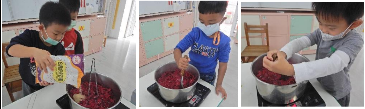
開始製作火龍果蜜餞~~將火龍果皮放入水中，倒入擠好的金桔汁，再倒入適量的糖~~(酸甜度依個人口味調整)，接著要一直攪拌攪拌，不要讓食材黏住鍋底，不然會燒焦喔!!!