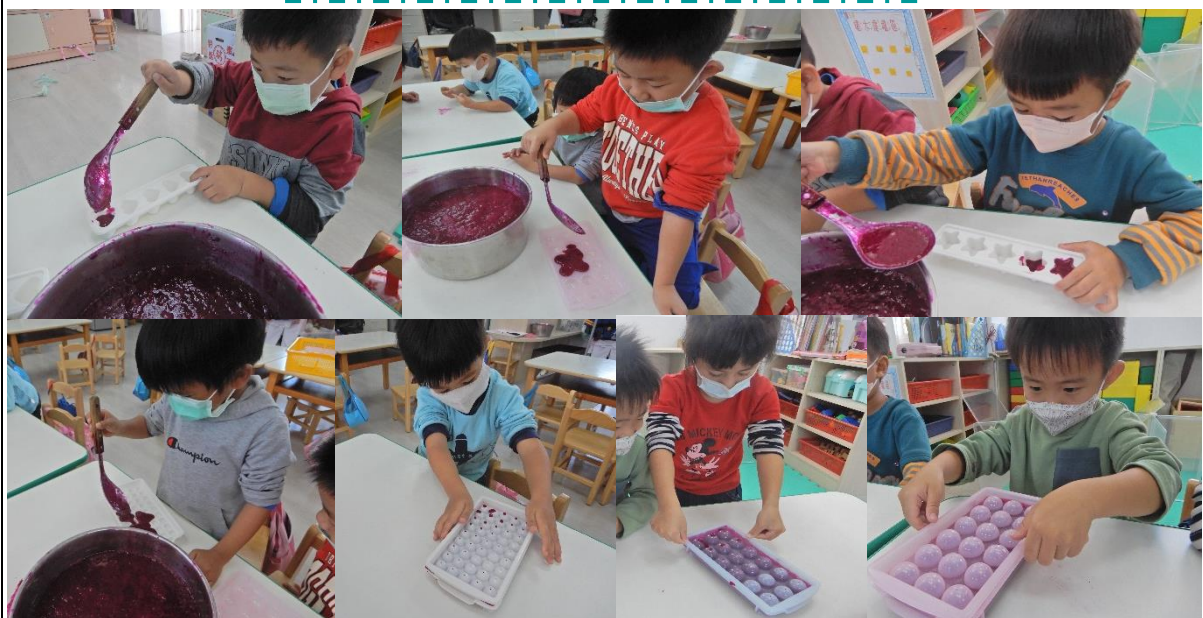
把打好的火龍果汁放入模具中，就可以拿去冰箱冷凍囉