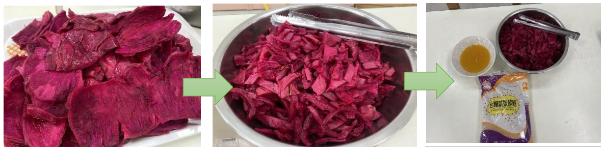
火龍果皮要先切塊、切絲後再加入調味的糖、檸檬汁.....一起煮！這次我們以金桔代替檸檬，不一樣的風味但是一樣的酸酸甜甜好滋味喔～ 也祝大家大「桔」大利