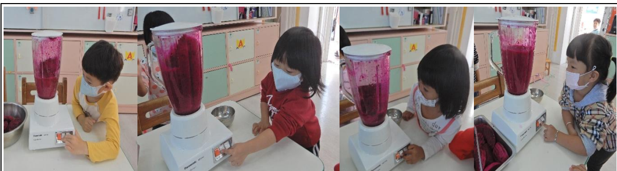
按下按鈕，即可獲得新鮮火龍果汁