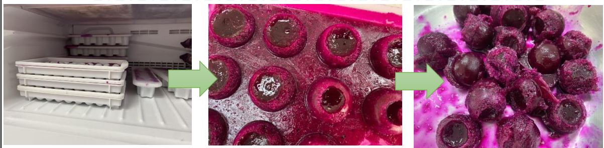
冷凍一段時間以後，確認是否結冰，結冰就可以倒出來。冰磚就完成拉！