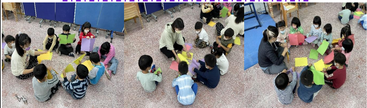
大中小班分組進行兔子創作~~~ 動手撕貼粉彩紙，組合成可愛的小兔子