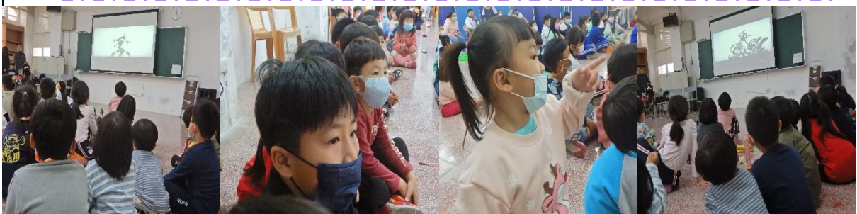
一起欣賞繪本動畫-小丑·兔子·魔術師