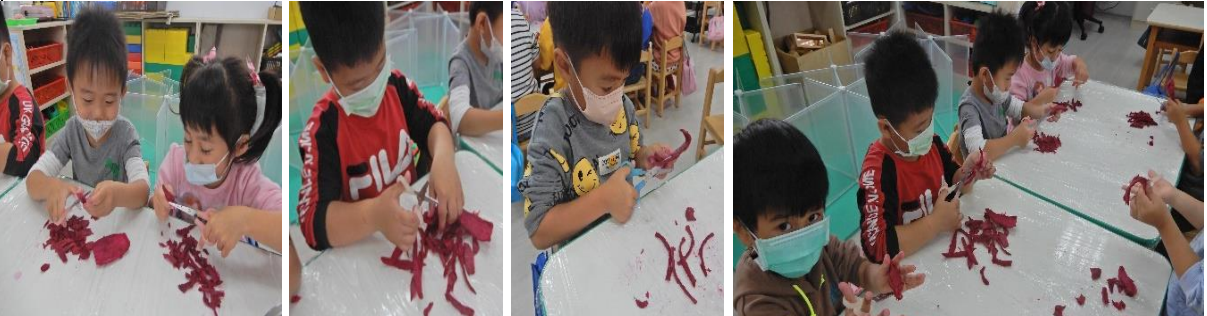
大班：使用塑膠刀將火龍果皮切絲 中班：使用剪刀剪火龍果皮