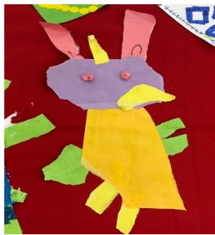
每隻小兔子都是 獨一無二的~