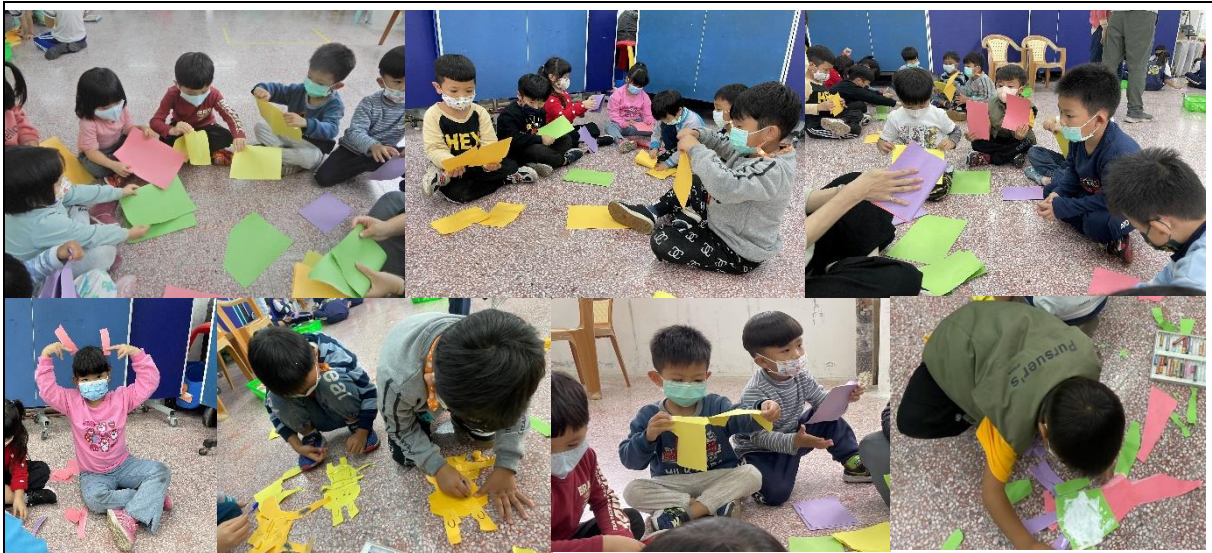
對中小班的孩子來說，這個創作還有點困難，大家互相幫忙一起完成！