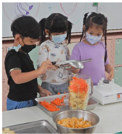
依序將食材放入果汁機裡