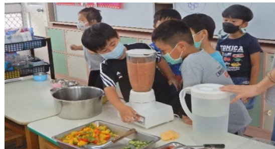
打出來是西瓜的顏色耶