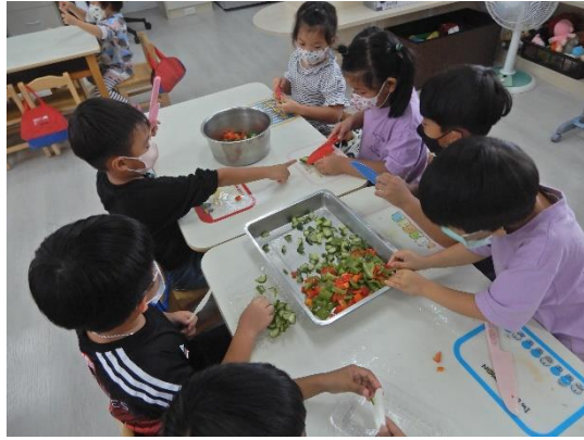
分組分工合作將食材處理好