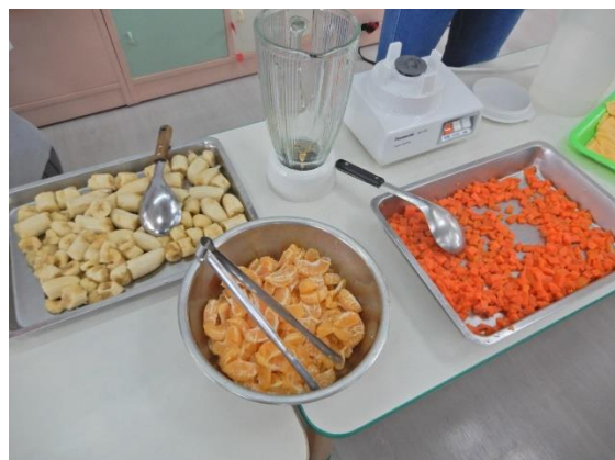
在大家的努力分工下，蔬果汁的食材準備好了

~~分組將食材處理好~~ 大班：川燙後將紅蘿蔔切小塊 中班：剝橘子把籽挑起來 小班：剝香蕉折小塊