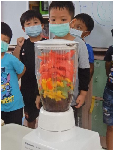
美麗的色打來是麼色 出會什麼顏色呢