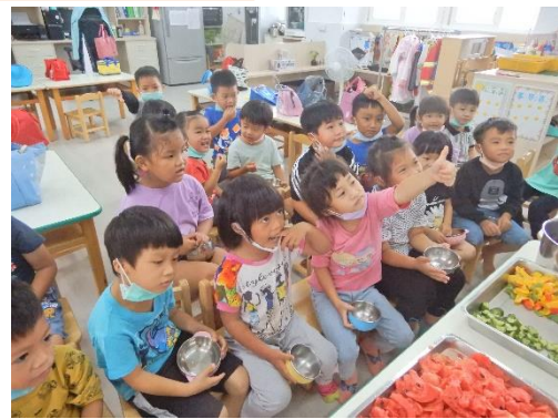
打蔬果汁之前先品嚐一下 川燙過後的小黃瓜和甜椒 大家都說好甜好好吃