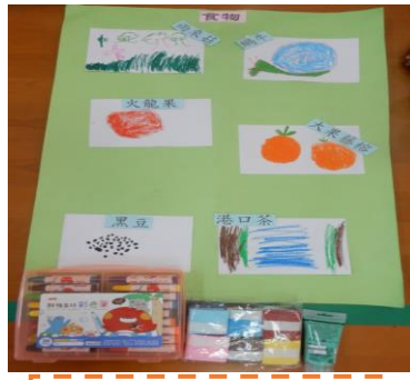
食物類-彩色筆、手揉紙、壓克力顏料