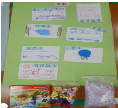
景點類-蠟筆、球、黏土