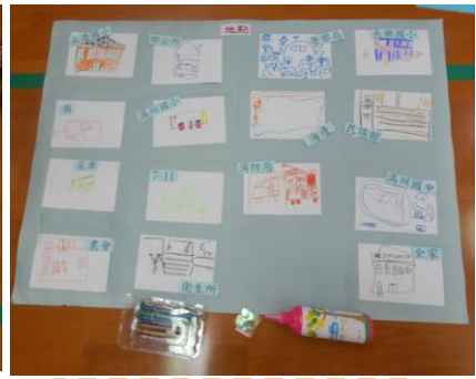
地點類-金屬麥克筆、亮片、手指顏料