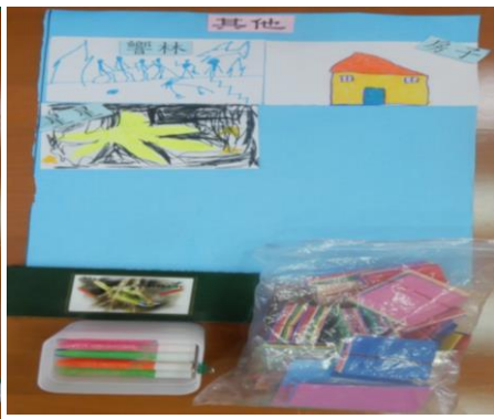
其他類-粉彩筆、金蔥筆、馬賽克貼