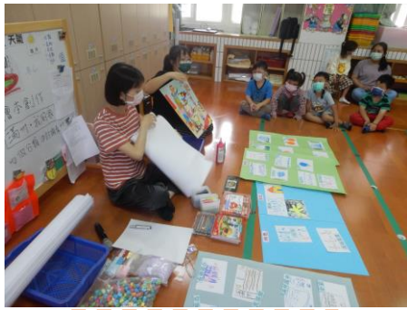
努力的討論繪本創作素材