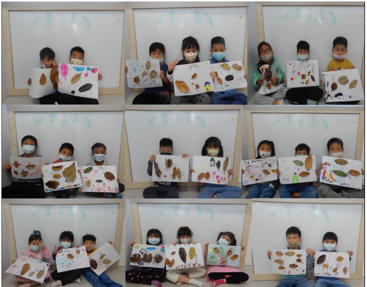
我們的葉子鳥完成囉!!是不是非常的可愛且充滿創意呢?