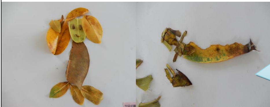
大海裡美麗的美人魚

沒有想到自然素材能拼貼出那麼豐富的圖案 孩子們不僅有想像力，連小細節也沒有忽略，好細膩