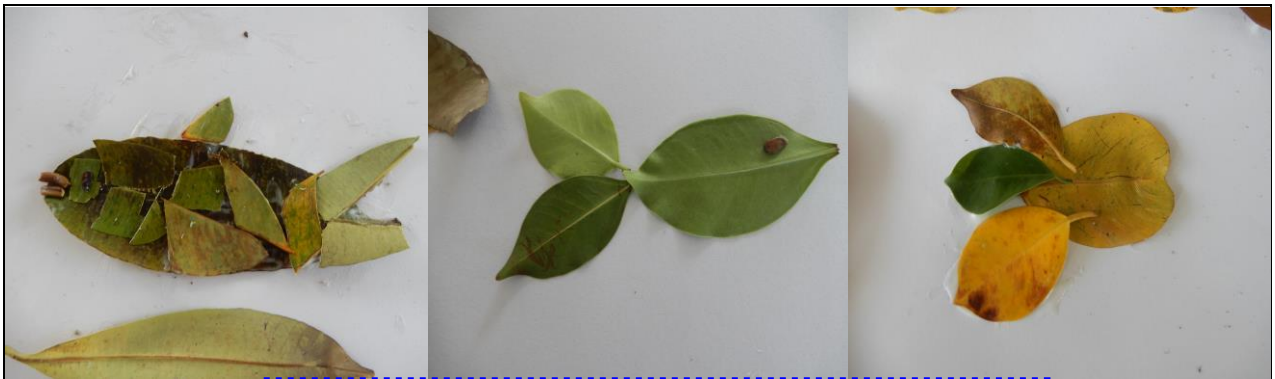
可愛的魚魚家族-鱈魚、吳郭魚、小金魚