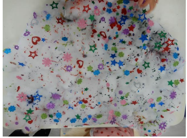
聖誕老鷹的身上多加了閃亮亮的貼紙，化身為一隻華麗的老鷹