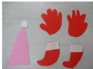
聖誕老鷹身上的裝備-麋鹿、雪橇、帽子、手套、襪子，都準備齊全了，準備出發送禮物去囉