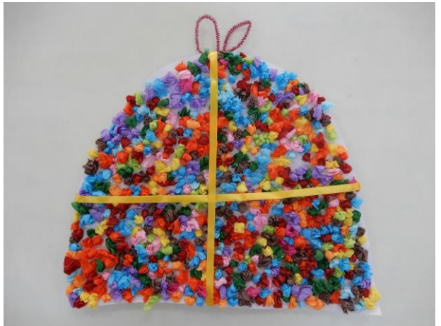
聖誕老鷹身上的禮物袋是利用皺紋紙揉成的