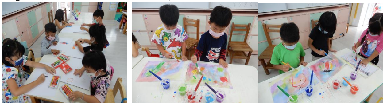
畫上蠟筆以後，用水彩筆刷上彩虹顏色的水彩，我們的作品變得好好漂亮喔~

一開始刷水彩孩子們都還是小心翼翼的，深怕一不小心毀掉自己的蠟筆創作。不過，發現水彩真的會神奇地「繞過」蠟筆以後，大家就開始用力揮筆，將作品刷上最繽紛的色彩囉！