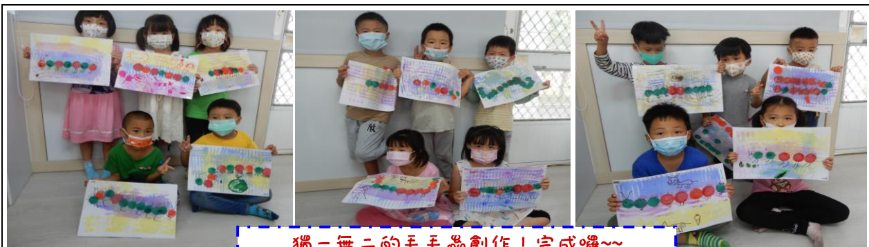
獨一無二的毛毛蟲創作！完成囉~~