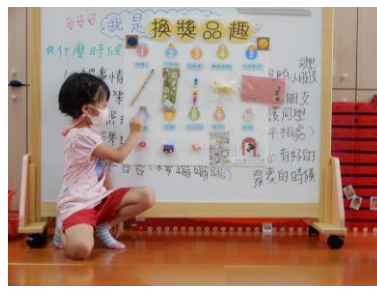
先從神秘袋抽出數字再找出相對應的獎品。有好多禮物可以兌換，超棒的！