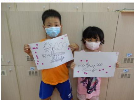
經過激烈的投票，最終選出兩張高票的圖案成為我們新的班服樣式囉！