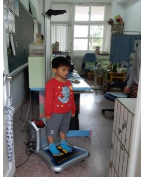
到保健室 測量 身高 體重