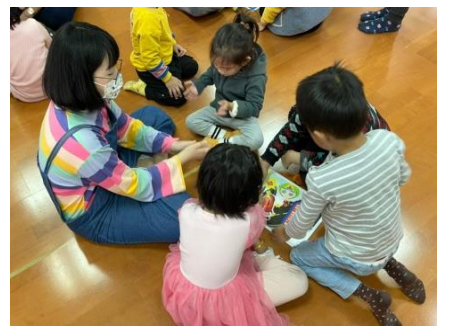
分組拼拼圖！到底會拼出什麼呢~好想知道喔！