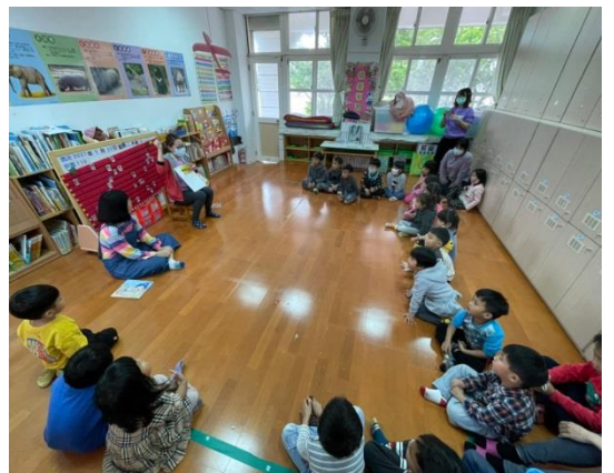
衛生所的姐姐們來幼兒園進行宣導活動囉！

孩子們經過宣導活動後都紛紛說，菸酒檳榔實在太可怕了，要有健康的身體、好的環境，真的「戒」就對了！