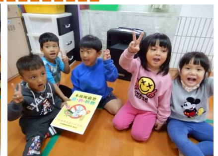
遠離菸酒檳榔，對環境、身體還是安全都好！