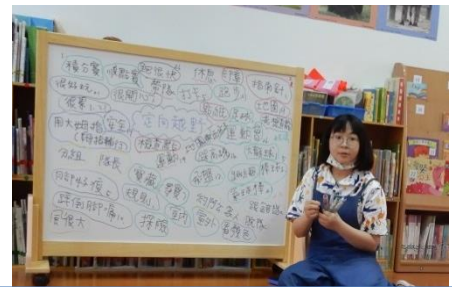
把孩子們所想到的都寫下來

想到定向越野孩子們會想到什麼呢？「打卡」「檢查點」「運動會」「順點賽」「地圖」……透過團體討論發現大家有好多好多的想法呢！我們將這些發想一一記錄下來，並與孩子們一起分類這些概念，形成了主題網。